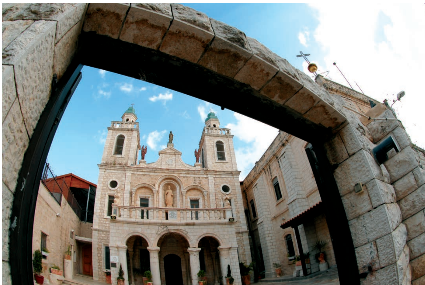
Kirche von Kana